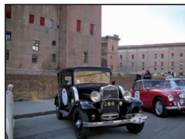
Valli e Nebbie 2007 - Prima della partenza da Piazza Castello