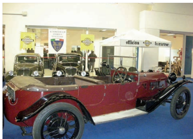
La Lancia Lambda "reginetta" del nostro stand

All'interno dei padiglioni dell'Ente Fieristico Ferrarese si è ormai consolidato questo appuntamento che raduna appassionati, collezionisti o semplici "curiosi" di automoto-biciclette.