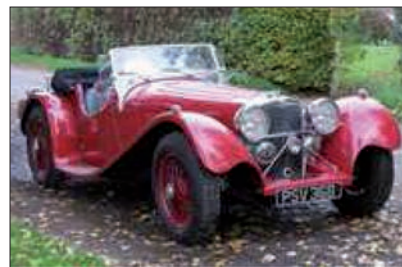
Jaguar SS 100