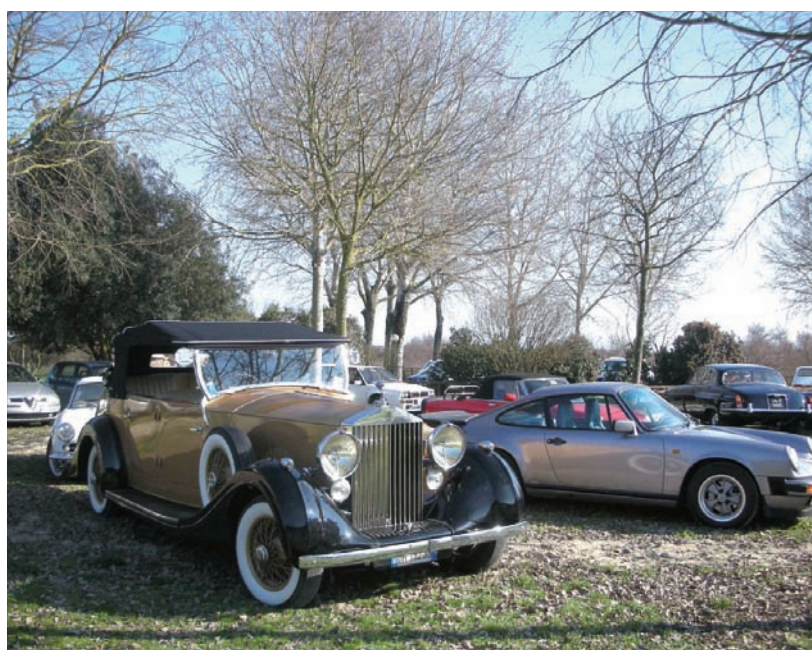
Una parziale (molto parziale) panoramica delle vetture partecipanti

Una vera anteprima, quindi, della manifestazione che verrà a meta Marzo e il risultato complessivo ci pare che sia di buon auspicio (il buon giorno si vede dal mattino...). Nel corso del raduno abbiamo potuto visitare il sistema di idrovore di Codigoro (uno dei più grandi d'Europa), punto fondamentale per l'equilibrio idrico della provincia di Ferrara. Seguendo poi le strade arginali del Volano siamo arrivati a Valle Bertuzzi dove abbiamo potuto ammirare il recupero ambientale eseguito con grande perizia e passione dalla attuale proprietà. Per concludere in "gloria" non ci siamo fatti mancare un ottimo pranzo a base di pesce nel casone di Valle Canneviè.